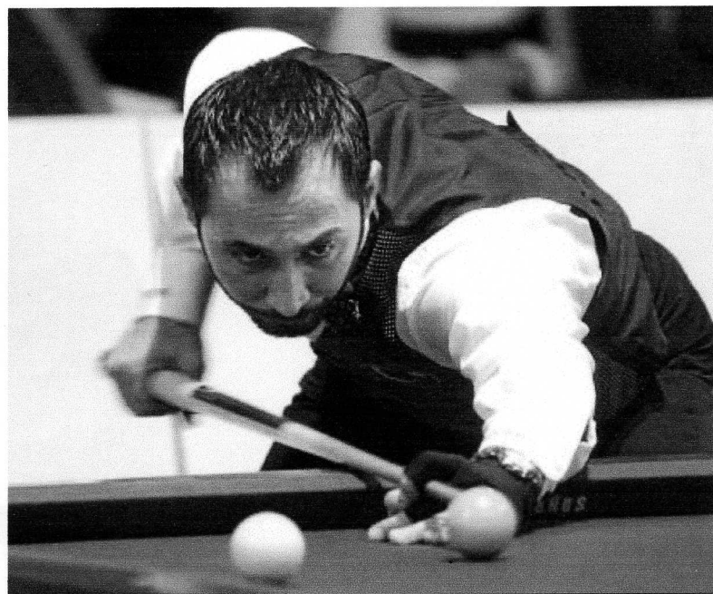
La iniciativa tiene como fin contribuir al fomento de la práctica del billar.